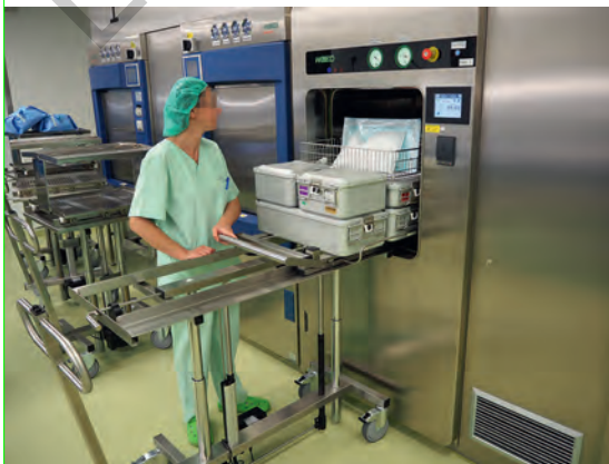
Abb. 4.1 Beladeseite Dampfsterilisator: Beschickung des Sterilisators [P1291]

Während die Beladung meist manuell in den Sterilisator geschoben werden muss, erfolgt die Entladung der (noch heißen) Charge in den meisten Fällen automatisiert. Bis zur